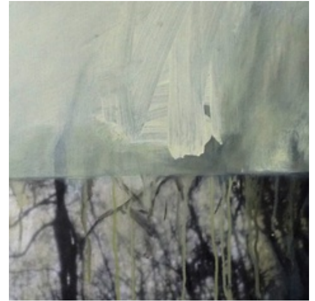
Détails des toiles présentées