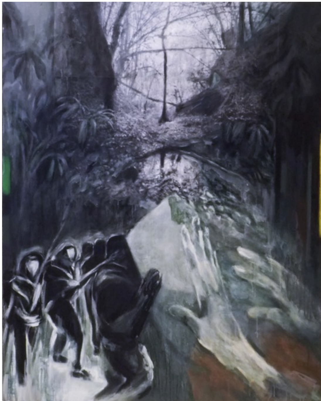
Prent y garda : Je vois tout, tout, 2017-2022, acrylique sur toile technique mixte, 162 x 130 cm