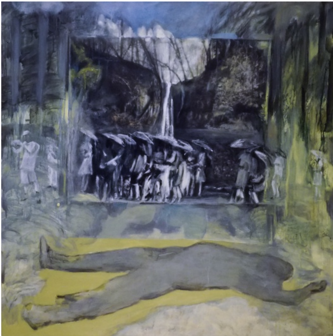
Prent y garda : Il y avait un homme là-bas, 2017-2022, acrylique sur toile technique mixte, 150 x 150 cm