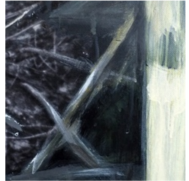
Détails des toiles présentées