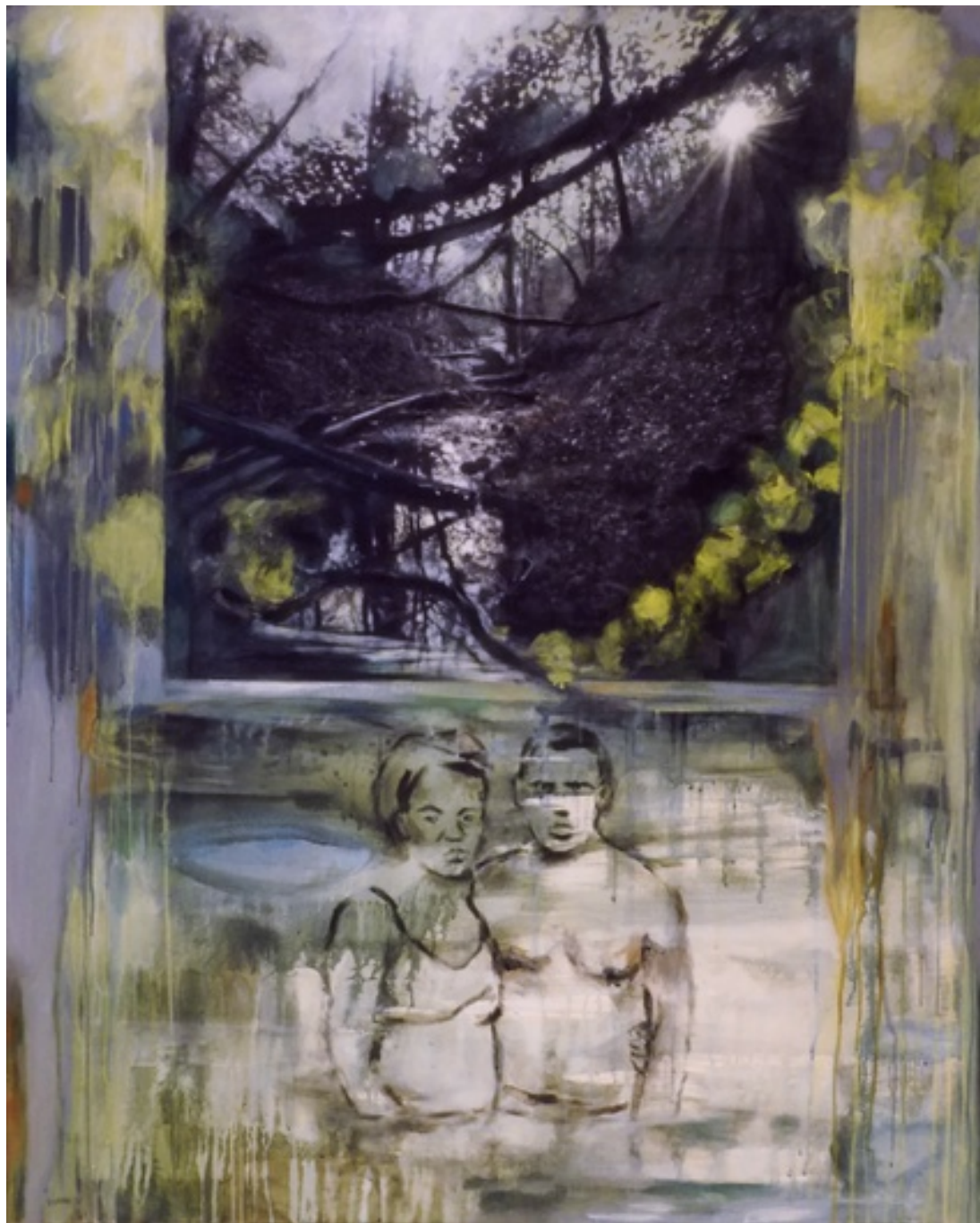
Prent y garda : Madame, Monsieur, 2017-2022, acrylique sur toile technique mixte, 162 x 130 cm