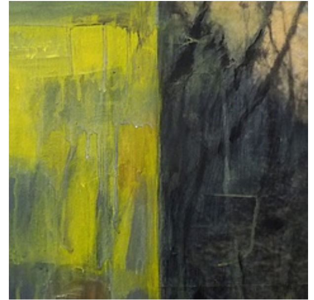
Détails des toiles présentées

J'ai entamé cette série de toiles en 2017, avec une curiosité et une interrogation : qu'allait donner la confrontation d'images de mon environnement proche, qui m'a construit, à celles du monde médiatisé, qui me traversent au quotidien ?