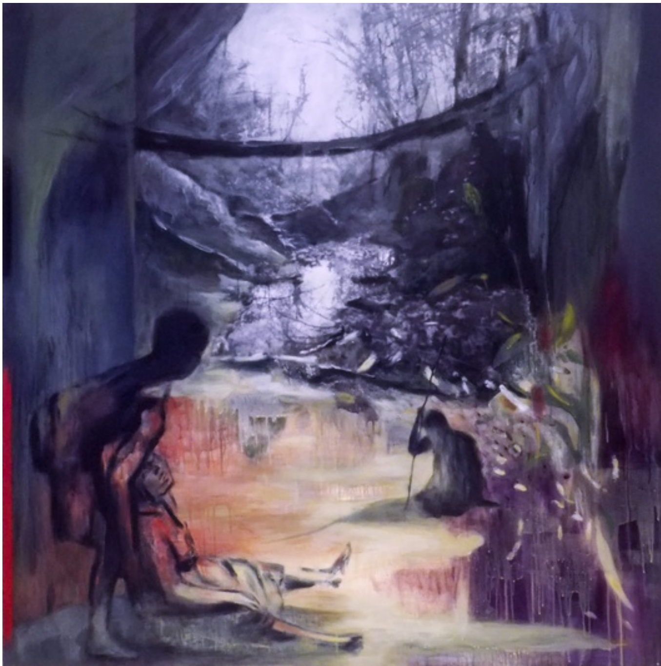
Prent y garda : Il y avait, 2017-2022, acrylique sur toile technique mixte, 150 x 150 cm